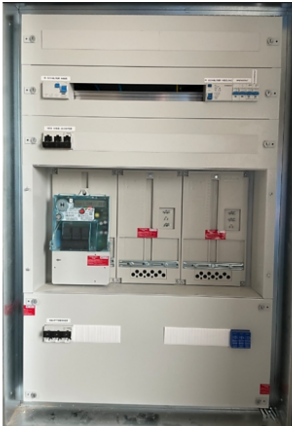
Abb.Beispiel Versiegelung Vorzählerbereich