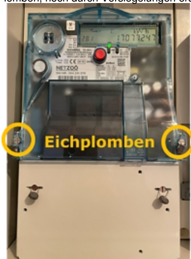
Abb. Eichplombe am Zähler

Die Eichplomben am Zähler unterliegen den Bestimmungen des Maß- und Eichgesetzes. Eine Entfernung oder Beschädigung von Eichplomben ist grundsätzlich unzulässig und führt bei Missachtung zur Verrechnung von Erhebungskosten und Eichkosten an den Anlagenbetreiber. Über eine polizeiliche Anzeige wird je nach Sachlage entschieden. Eichplomben dürfen somit weder durch herkömmliche Plomben, noch durch Versiegelungen ersetzt werden.